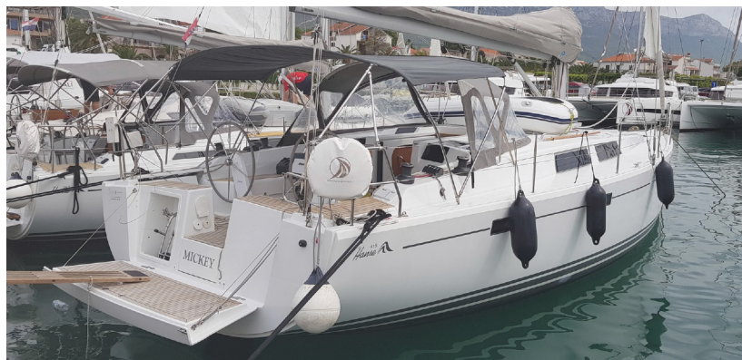
„Mickey“ Hanse 415 (2016)

Erhalte einen Einblick in das unvergleichbare Segelgefühl! Gleite auf einem modernen Segelboot übers Meer! Keine Segelkenntnisse erforderlich!